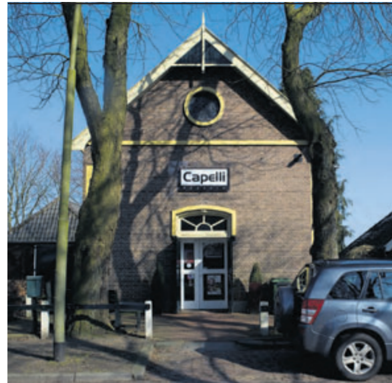
De kerk van Sleen is nu een kapsalon.