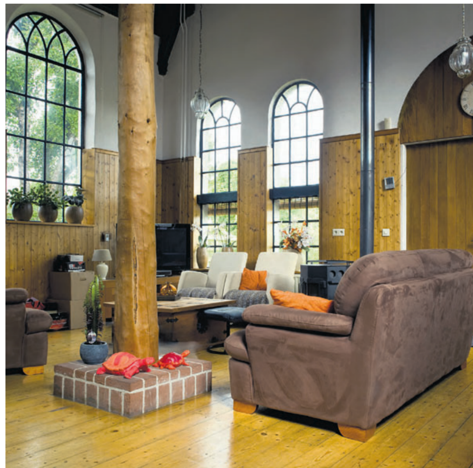
Binnen in de kerk van Smilde.

Eric le Gras, Hans Ladrak en Sake Elzinga: Gods huisjes, Drentse kerken van bescheidenheid . In Boekvorm Uitgevers, 19,50 euro.