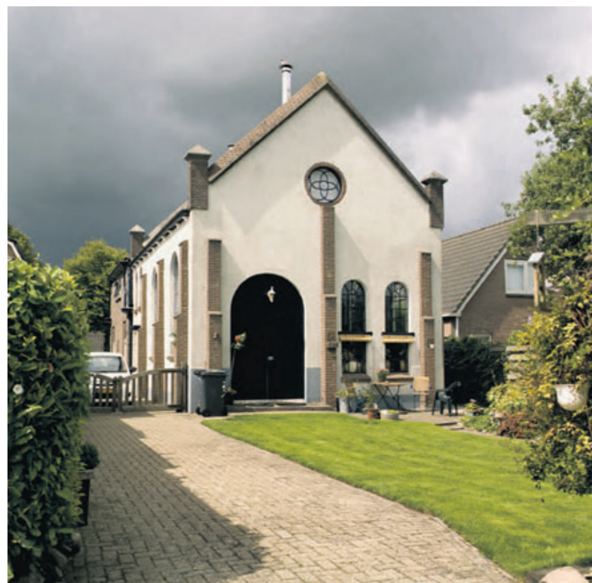
De kerk in Smilde werd een woonhuis.

Veel kerkgebouwen worden gesloopt, sommige krijgen een tweede leven. Als schietbaan. Of kinderdagverblijf. Sake Elzinga fotografeerde Drentse kerken in hun nieuwe functie. Vandaag verschijnt het boek.