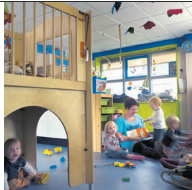
De kerk van Wijster is een kinderdagverblijf.