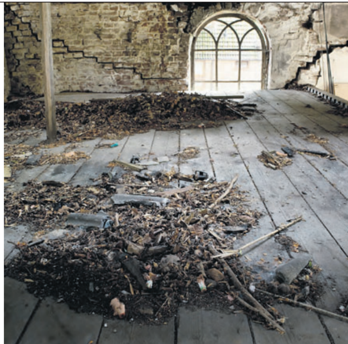
De kerk van Dommerskanaal.